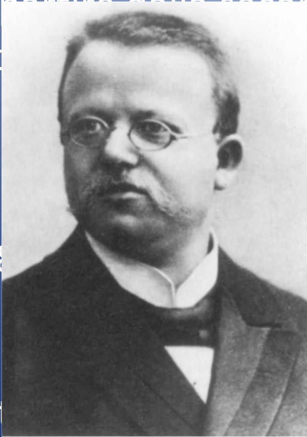
Hermann Oppenheim 1.1.1858 – 22.5.1919