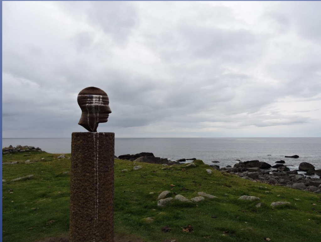
Markus Raetz Artista svizzero